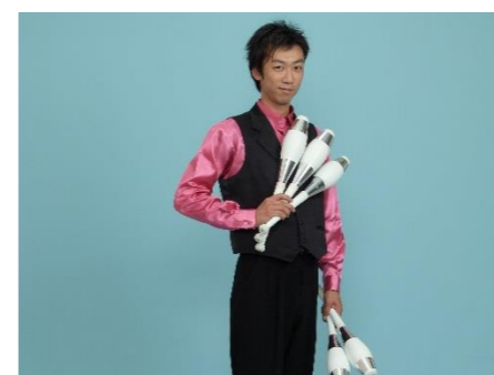
もんたくん(大道芸)