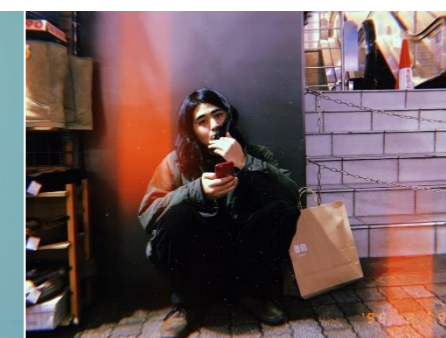
グンナイ小形(シンガーソングライター)