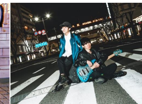
YOLCA (Taiki x Yuichi) (ベース x ビートボックス)