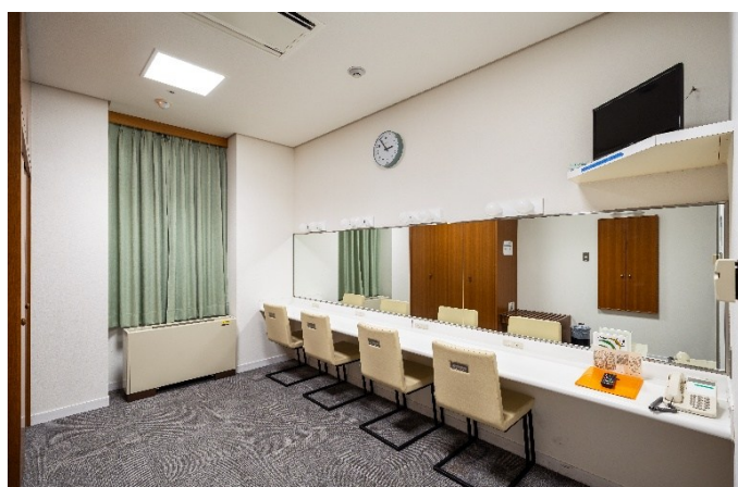
楽屋 6 18㎡ 定員4人