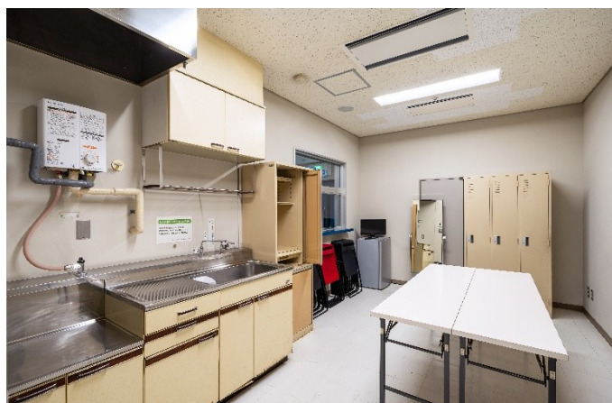
主催者事務室 15㎡ 定員5人