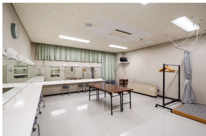
楽屋 10 34㎡ 定員17人