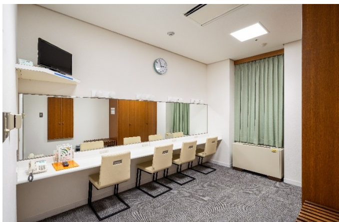
楽屋 5 18㎡ 定員4人