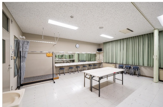
楽屋 7 26㎡ 定員18人