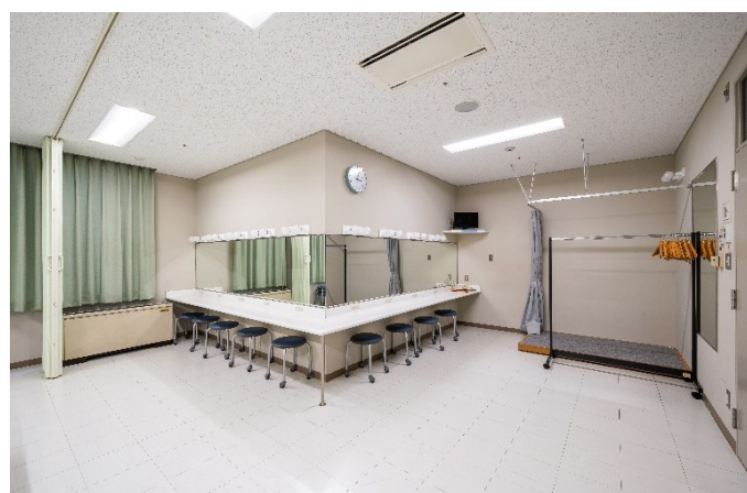
楽屋 8 22㎡ 定員9人