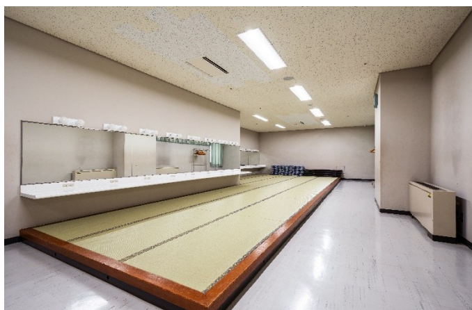
楽屋 9 67㎡ 定員28人